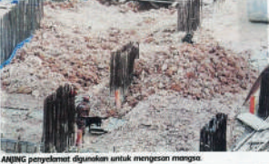
ANING penyelamat digunakan untuk mengesan mangsa