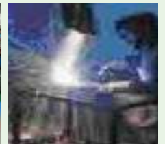
Penggunaan penyedut udara setempat