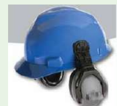
Topi keselamatan dan pemalam telinga