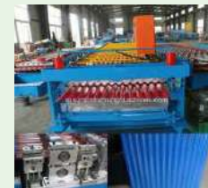
Penggunaan penghadang mesin