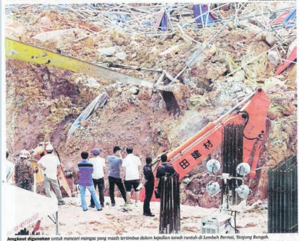
Langkah digunakannya untuk memori mangsa yang masih tertimbun di dalam kawasan tanah runtuh di Lembah Permai, Tanjung Bungah.