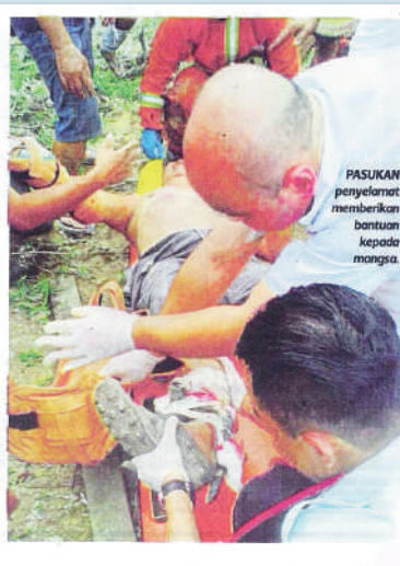
PASUKAN penyelamat memberikan bantuan kepada mangsa.

"Mangsa kemudian dibawa ke Hospital Lawas untuk rawatan lanjut dan dilaporkan dalam keadaan stabil," katanya.