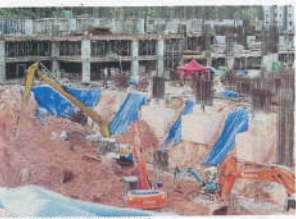
EMPAT jangkitan menggali tanah runtuh