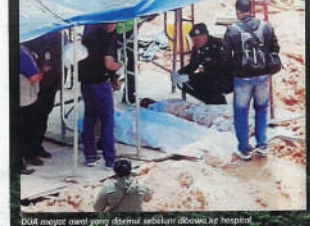
IKAH mangsa awal jang ditemui sebelum dibawa ke hospital