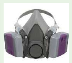
Alat penapis pernafasan (respirator)