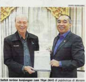
Salleh berinisiatif menjemput Lee Tee (kiri) di pejabatnya di Mirvco EXIM, semalam.

Kuala Lumpur: Institut Keselamatan dan Kesihatan Pekerjaan (NIOSH) akan bekerjasama dengan Kementerian Komunikasi dan Multimedia (KKM) bagi mengagihkan kempen kesedaran dan latihan mengenai amalan kerja yang selamat untuk pengamal media, tahap ini. Pengerusi NIOSH, Tan Sri Lee Lay Tee, berkata program ini bagi menyensitaskan bagi para-pengamal media untuk meningkatkan kesedaran dan latihan mengenai amalan kerja yang selamat untuk pengamal media di negara ini. "Pengamal media bertanggungjawab kepada masyarakat dan keselamatan dan kesihatan pekerjaan (KSEK) mengenai keselamatan peritran media ketika bekerja. Bekas berkata, ketika ini pengamal media masih dibantu agensi-agensi untuk memastikan bahawa peritran keselamatan peritran media yang dibekalkan NIOSH dan Keselamatan dan Kesihatan Pekerjaan (KSEK) mengenai keselamatan peritran media ketika bekerja. Bekas berkata, ketika ini pengamal media masih dibantu agensi-agensi untuk memastikan bahawa peritran keselamatan peritran media yang dibekalkan NIOSH dan Keselamatan dan Kesihatan Pekerjaan (KSEK) mengenai keselamatan peritran media ketika bekerja.