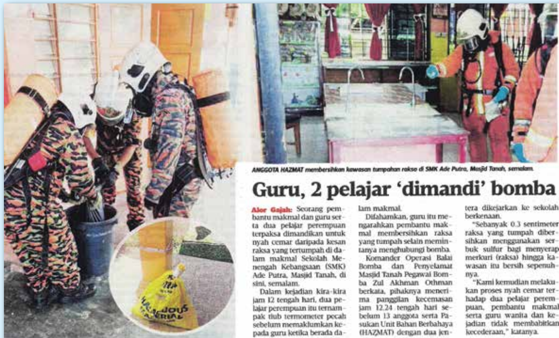
ANGGOTA HAZMAT membersihkan kawasan tumpahan rakso di SMK Ade Putra, Masjid Tanah, semalam.

Publication: Utusan Malaysia Date of Publication: 17 May 2017 Page number: 33