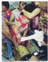
ANAK271 berkerja beramai-beramai mengisar tangan seorang wanita yang terbelit tersepit dalam mesin pengisar daging di sebuah kilang pengisar daging di Taman Sentosa, Klang semalam.

"Mangsa kemudiannya dibawa ke Hospital Tengku Ampuan Rahimah, Klang untuk mendapatkan rawatan lanjut.